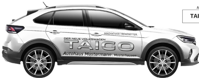
Art. Nr.: TAIGO-02