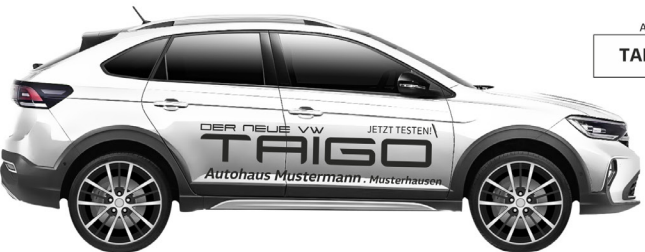
Art. Nr.: TAIGO-03