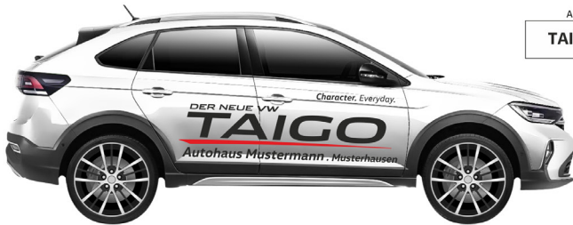
Art. Nr.: TAIGO-01