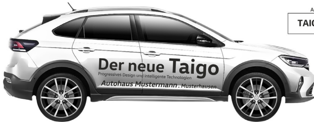
Art. Nr.: TAIGO-ECO