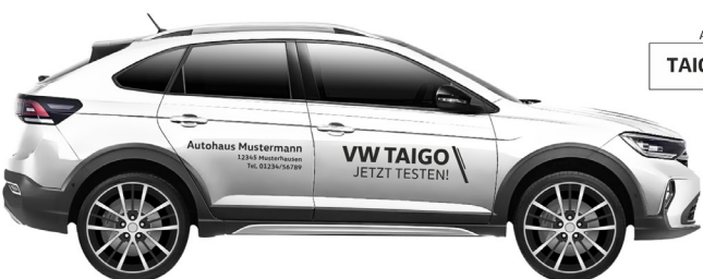
Art. Nr.: TAIGO-MINI